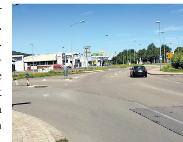
Hier entsteht der neue Kinokreisel

Der Zustand vieler Zweibrücker Straßen ist bekanntlich schlecht. Aber das wird sich jetzt ändern. Nachdem die SPD und der Stadtrat das Thema „wiederkehrende Beiträge“ erfolgreich umgesetzt haben und ein Ausbauprogramm für die Zweibrücker Straßen im Stadtrat beschlossen worden ist, kann es nun mit dem Straßenausbau auch endlich losgehen. Die ersten Projekte sind definiert. Nach den Straßen in den Breitenwiesen geht es bald weiter im Bereich des „Kino Kreisel“. Damit wird das lästige Verkehrsnadelöhr Lanzstraße/Gottlieb-Daimler-Straße deutlich entschärft. Zudem entsteht gemeinsam mit dem „Überflieger“ eine neue Verkehrsführung die spürbar den gesamten verkehrintensiven Bereich entlasten wird. Ebenfalls eine große weitreichende Baumaßnahme zur Verbesserung der Verkehrsinfrastruktur: der „Kreisel am Nagelwerk“. Weitere Erneuerungen maroder Straßen werden folgen, ohne dass die Anwohner enorme Beitragsleistungen aufbringen müssen. Natürlich werden diese Projekte während der Bauzeit zu Staus und notwendigen Umwegen und damit zu Ärger bei den Verkehrsteilnehmern führen. Aber: nach den Bauarbeiten wird es zu