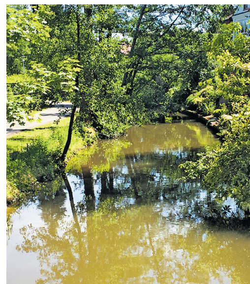
Die ökologische Aufwertung