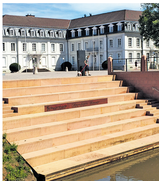
Die Fischtreppe am Herzogplatz

Alles in allem ein zweijähriges intensives Großprojekt, das Zweibrücken schöner macht und vor allem auf das die Zweibrücker stolz sein können.