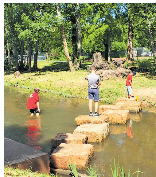
Wasser erlebbar für alle Generationen